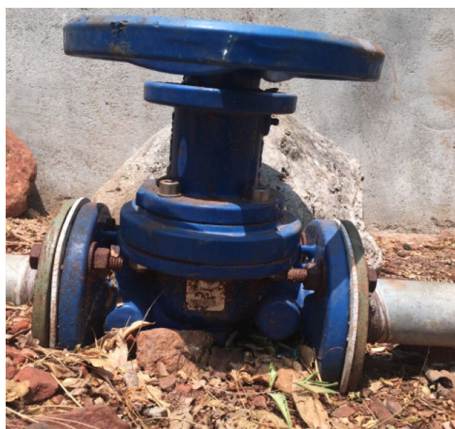
Регулятор VAG DURA